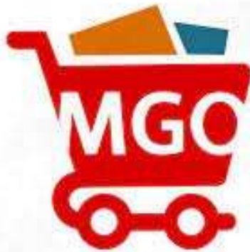
Gambar 1.1 Logo Marhani Grocery Online (MGO)

Salah satu E-commerce yang dapat menjadi alternatif bagi masyarakat Kota Timika dalam memenuhi kebutuhan pokok sehari-hari yaitu Aplikasi Marhani Grocery Online (MGO), di mana Aplikasi ini merupakan salah satu Aplikasi belanja online yang tersedia untuk masyarakat Kota Timika dengan menyediakan berbagai barang/produk yang di tawarkan berupa bahan pokok sembako untuk memenuhi kebutuhan masyarakat yang tinggal wilayah Kota Timika. Aplikasi Marhani Grocery Online diperkenalkan oleh Pak Ardi, yang berlokasi di Jalan Serui Mekar dan untuk Aplikasi Marhani Grocery Online sendiri sudah dapat di Download di Aplikasi Play Store .