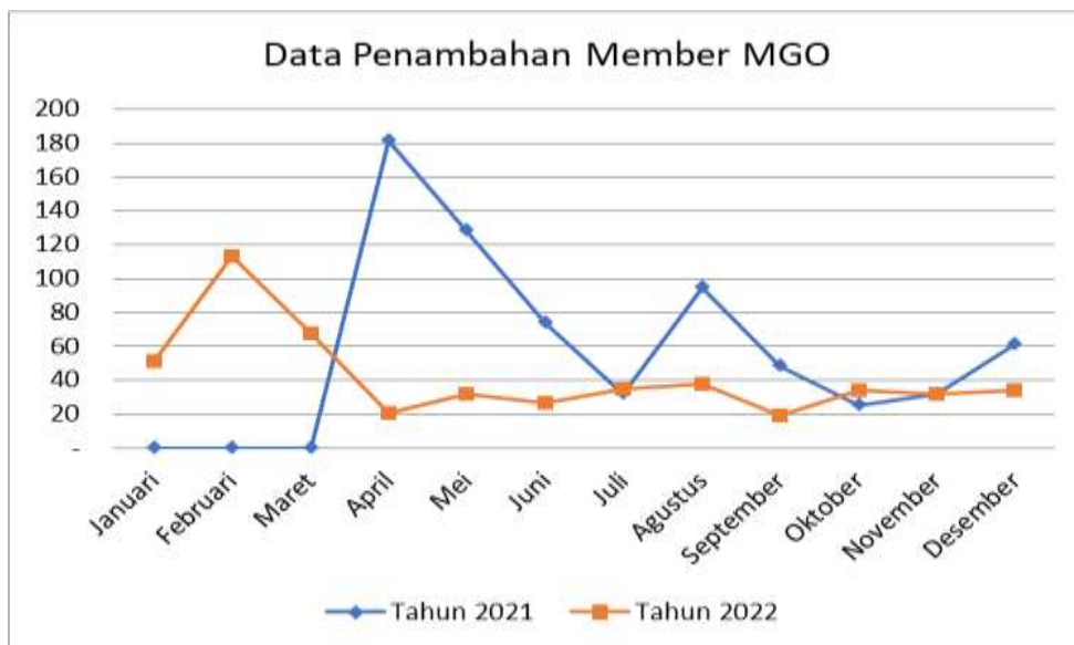
Gambar 1.3 Grafik New Member Marhani Grocery Online (MGO)

Selain tabel diatas juga terdapat grafik data New Member Marhani Grocery Online (MGO) sebagai berikut :